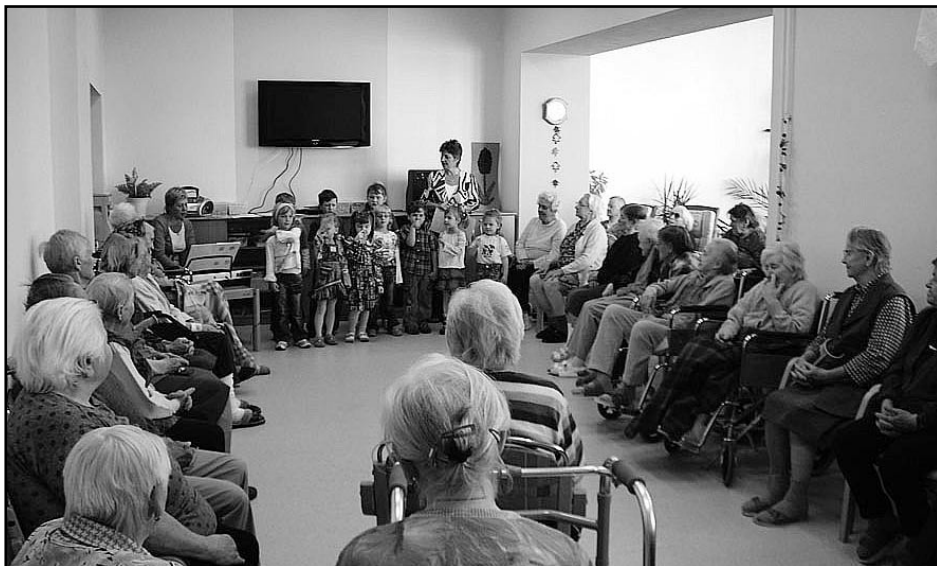
pásmo písní a básní dětí z Mateřské školy Chelčice v zimní zahradě

Poslední říjnový den zavítaly do našeho domova děti z Mateřské školy Chelčice , které předvedly mnoho písní, básní a tanečků. Za pěkné pásmo jsme dětem moc vděční, neboť jejich dětská přirozenost a optimistický náhled na život je pro nás obohacující.