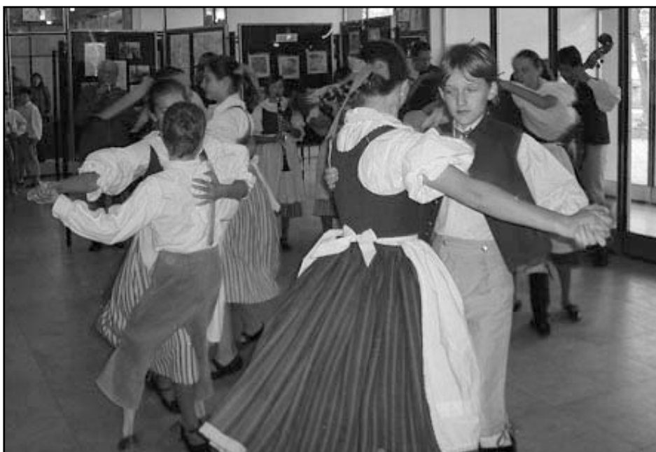
taneční vystoupení folklorního souboru Prácheňáček ze Strakonice

CSP Vodňany ve spolupráci se Svazem postižených civilizačními chorobami, Dobrovolným svazkem Blanicko-Otavského regionu a Městem Vodňany organizovalo v osmi týdenních programech od června do října projekt s názvem „ Terapeutická setkání zdravotně postižených “. V těchto programech měli zájemci příležitost seznámit se s animoterapií, aromaterapií, artete-