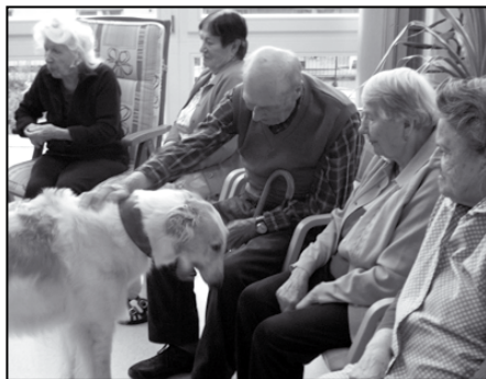
pohlazení „chrtího krasavce“ je pro naše seniory milým okamžikem

Ve středu 13. srpna nás v rámci „Kanysterapie“ navštívili dva policejní psovodi se svými chrtími miláčky „Burkou a Aničkou“. Dozvěděli jsme se vše o jejich výchově, stravě, návycích, ale i o jejich práci pro Policii ČR. Mezitím měli naši senioři příležitost je nakrmit i pohladit. Tito psí kamarádi mají na seniory velmi dobrý vliv, neboť setkáním s nimi získají pozitivní působení na psychiku a zdraví, a dostávají se tak do stavu lepší psychické i fyzické pohody.